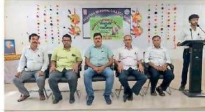
पुण्यतिथि पर आयोजित कार्यक्रम में शिक्षकगण व छात्र।