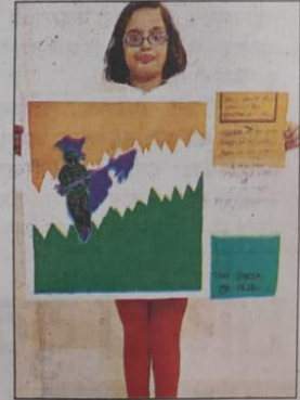
जीडी गोयनका स्कूल में कारगिल दिवस पर पोस्टरल प्रतियोगिता में शामिल छात्र।

गया। कारगिल युद्ध में शहीद हुए वीर सपूतों की याद में जगह-जगह कार्यक्रम हुए। इसी कड़ी में जीडी गोयनका पब्लिक स्कूल गया में भी सोमवार को कार्यक्रम हुए। स्कूल के छात्र-छात्राओं ने ऑनलाइन कार्यक्रम के जरिए अपने-अपने तरीके से शहीदों को नमन किया। स्लोगन, गीत, कविता, नृत्य आदि की प्रस्तुति देकर वीर सपूतों को श्रद्धांजलि दिया। बच्चों ने पेंटिंग के जरिए कारगिल के घटनाक्रम को दिखाने की शानदार कोशिश की। किसी ने कारगिल की दुर्गम पहाड़ियों को उकेरा, तो किसी ने युद्ध में लड़ते वीर सपूतों को दिखाया। बच्चों की पेंटिंग देखते बनी।